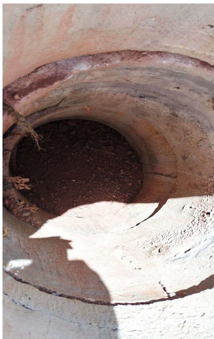
Figura 3- DRENO DE GÁS ENTUPIDO