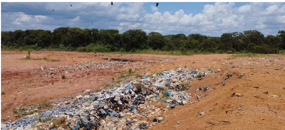
Figura 1- Não Cobrimento de Resíduos, e acúmulo de chorume na vala.