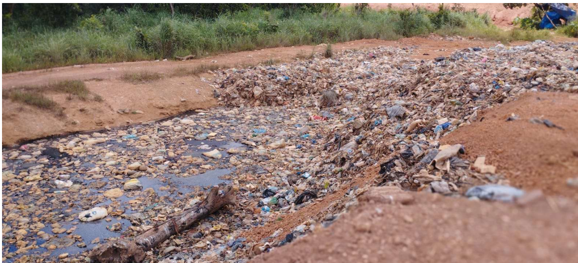
Figura 5-Acúmulo de Chorume na vala (1)