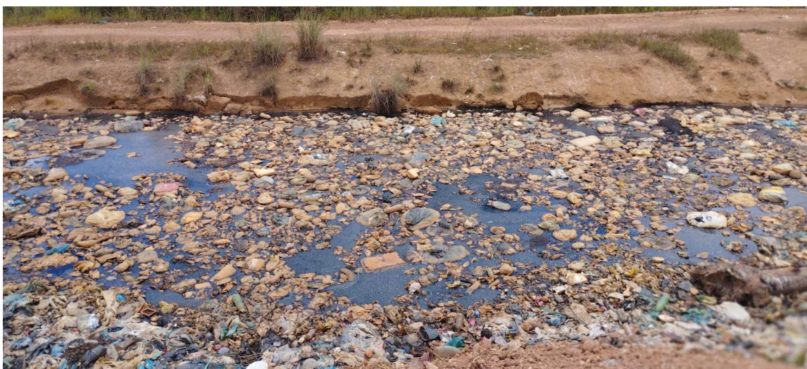
Figura 6-Acúmulo de Chorume (2)